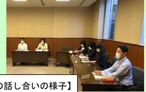
【代表の先生方の話し合いの様子】