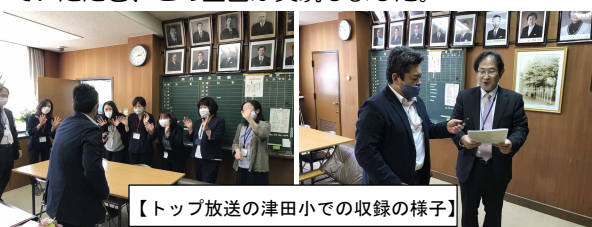
【トップ放送の津田小での収録の様子】

このような時に、FMはつかいちさんの方から、「先生が子どもたちに語りかけるコーナーをしてみませんか」と声をかけていただき、この企画が実現しました。