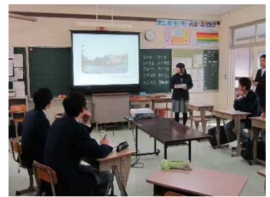
佐伯高校3年「さえき学」