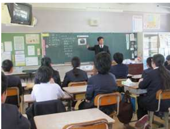
《中学校に向けて6年生も交流です。》