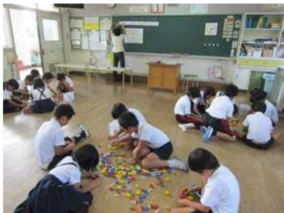
《2年生が図工の勉強をしました》