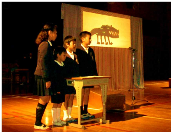
《玖島小学校の友達が影絵を披露》