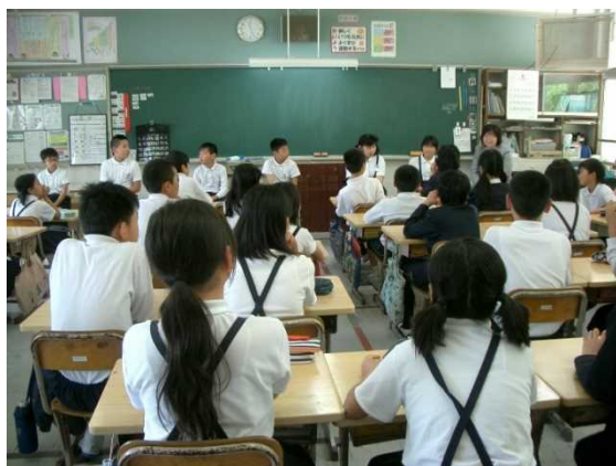
《初めての交流授業、少し緊張気味です》