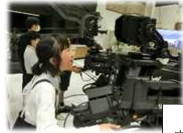
5・6年 広島テレビ 平和公園