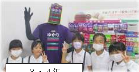
3・4年 三島食品工場 こども文化科学館