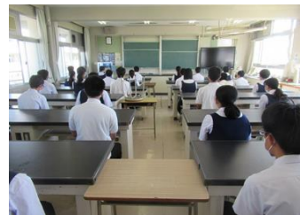
放送による始業式

さて、コロナウイルス感染防止に多くの国民が気を付けています。皆さんも、引き続き、3密に気を付け、朝の検温、マスクの着用、十分な手洗を行ってください。特に、マスクをはずさなければならない食事中は、飛沫がとばないようにおしゃべりは控えてください。