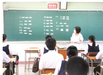
2学期の委員会・係決め