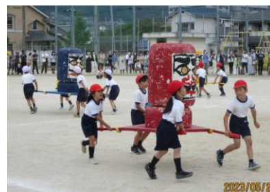
3年 ダルマさんを運んだ!