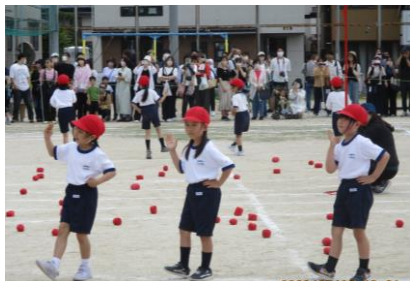
1年 ダンシング玉入れ