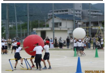
4年 心を合わせて大玉運び