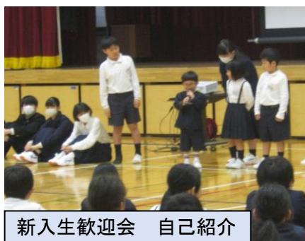
新入生歓迎会 自己紹介

4月28日(月)に1年生・7年生歓迎会・縦割り班集会を行いました。自己紹介の後、1年生は好きな食べ物や色などを、7年生は中学生になって頑張りたいことを発表しました。大勢の前での発表に緊張気味でしたが、全校児童・生徒で行った「貨物列車」の頃には、みんな笑顔が溢れていました。温かい雰囲気にも包まれた歓迎会でした。その後の縦割り班集会では、自己紹介をした後、班ごとに「だるまさんがころんだ」などのゲームをしました。9年生を中心にリーダーシップを発揮してくれたおかげで、新しい班での交流が深まりました。