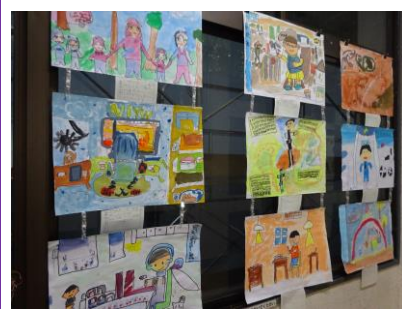
図画工作科の作品