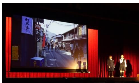
各学年の発表 ～宮島の歴史や文化が学べました～