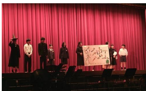
開会行事～スローガン発表～

10月31日(金)、宮島文化発表会を行いました。当日はあいにくの雨模様でしたが、多くの方々に来校していただき、子どもたちの頑張る姿を見ていただくことができました。児童生徒会執行部によるオープニングに始まり、吹奏楽部の演奏、宮島文化部の発表、意見発表 VOIVE2025、合唱、そして宮島をテーマとした1年生から9年生の発表、どれをとっても子どもたちの成長が感じられる発表となっていたと思います。最後に発表会を締めくくった宮島太鼓の演奏は気迫あふれるものとなりました。また、校内に展示された作品はどれも力作揃いでした。子どもたち一人一人の個性が光る発表会となりました。