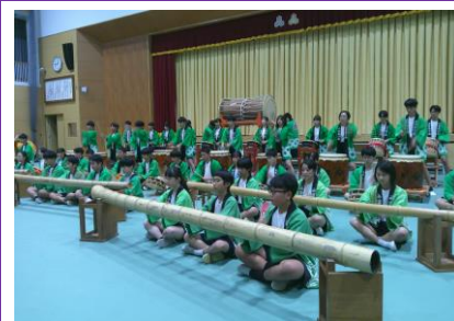
宮島太鼓「宮島舞紅葉(潮騒の輝き)」