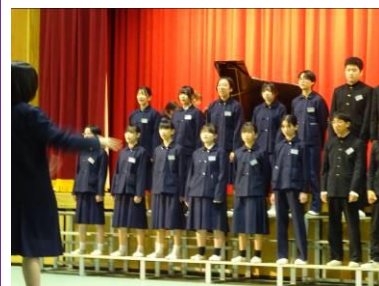
後期ブロック合唱「タイムリーパー」