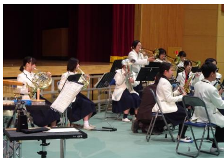
「空まで響け！宮島サウンド」