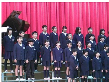
前期ブロック合唱「With You Smile」