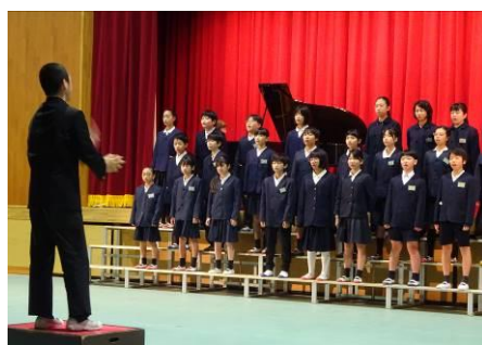
中期ブロック合唱「マイ パラード」