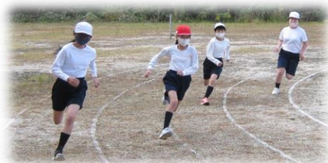
本番に向けての 練習風景①