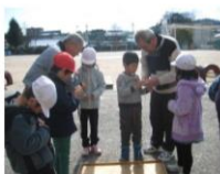
1年生 生活科「こままわし」

暦の上ではもう春ですが、まだまだ寒い日が続いております。インフルエンザも流行しています。皆さん、体調にはくれぐれも気をつけましょう。 さて、1月から宮内っ子応援隊の活動が始まりました。書写や家庭科、生活科、図工の授業でたくさんの方に支援いただき有難うございました。支援の様子の一部を写真にて、ご紹介させていただきます。