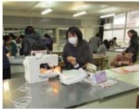
5年生 家庭科「ミシン」