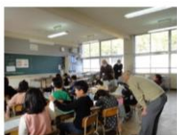
2年生 図工「カッターの使い方」