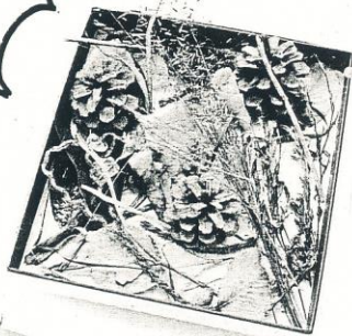
いっしょの自然の集まりです。

来週20日(金)の図工で「集めてならべてマイコレクション」という学習をします。 おかしの空き箱やトレイなどに集めた自然のものをならべて友だちとコレクションを見せ合います。 19日(木)までに 空き箱やトレイを子どもさんと相談して持たせてください。