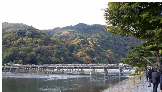
○レストラン嵐山 修学旅行最後の食事です。