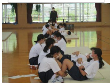
体育:新体力テスト

また,夜にはPTA総会が開かれました。対面での実施は3年ぶりとなりました。今年度から小学校と中学校のPTAを一つにまとめ大野学園PTAとして新たに組織されました。役員の皆様どうぞよろしくお願いいたします。様々な活動が制限される中でも,自分たちのできることを,と尽力して下さった令和3年度のPTA役員の方々お疲れ様でした。