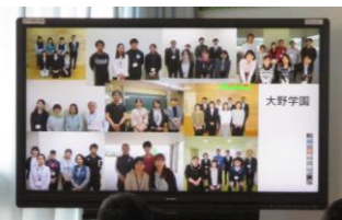
大野学園の先生たち「いじめは許しません。全員で皆さんを支えます。」