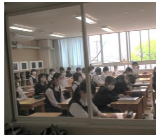
集中して聞いています(8年生)