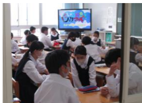
7年道徳「そのいじり大丈夫？」 「いじり」は必要かを話し合っています。