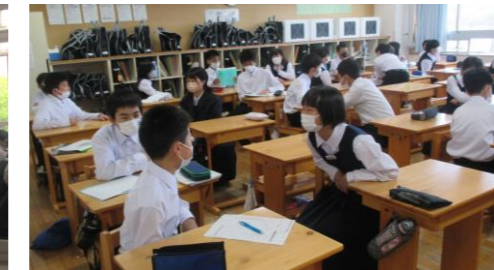
行ってみたい都道府県について楽しそうに 伝え合っています(7年生)