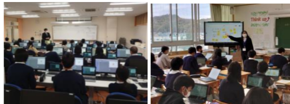
6年3組 技術 「プログラミング」