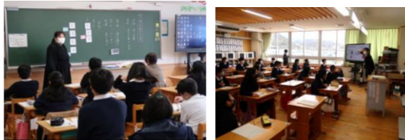
6年1組 国語 「漢文の読み方」