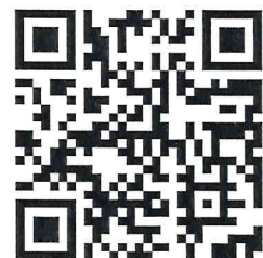
(アンケートQRコード)