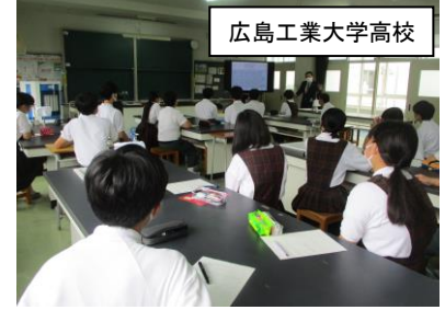
広島工業大学高校