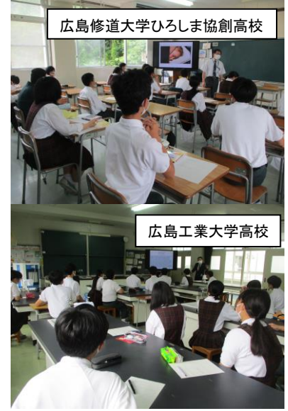
広島修道大学ひろしま協創高校