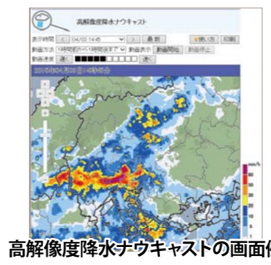
高解像度降水ナウキャストの画面例

気象庁が提供する降水の短時間予報です。気象庁の雨量レーダーや、全国の雨量計データを活用し、降水分布を1時間先まで予測しています。