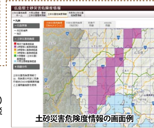
土砂災害危険度情報の画面例

広島県内を5km四方の領域(メッシュ)ごとに分割して地域の詳細な土砂災害発生の危険度を表した情報です。