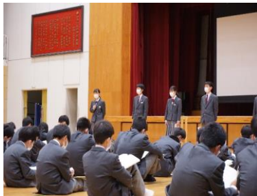
生徒会執行部の説明

四季中三大規律 語先後礼 最初に挨拶をして、その後にお辞儀をします。 時を守る 授業が始まる2分前には次の授業の準備をして座っておきます。 場を清める 自分の場所やみんなで使う場所を清潔に保ちます。