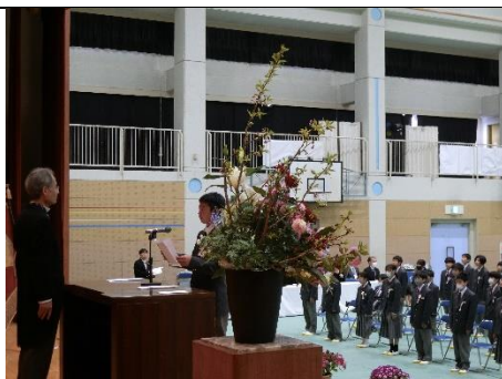
【新入生誓いの言葉】