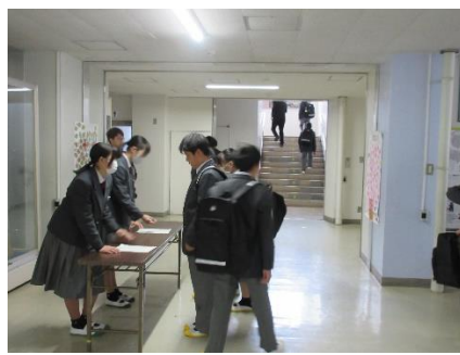
【生徒会執行部による新入生の受付】