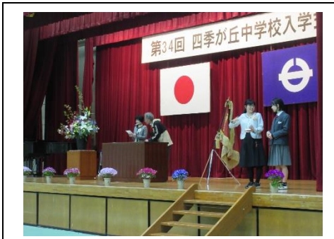
【入学式リハーサル】

4月9日(火)に入学式を挙行し、69名の新入生が入学しました。入学式のために、3年生が体育館の会場づくり、2年生が校内の掃除を行いました。多目的室前には先輩たちからのメッセージが掲げてあります。また、四季中サポート隊の方々に看板を設置していただいたり、当日は駐車場係を担当していただいたりしました。多くの来賓や保護者の方が見守る中、1年生は立派な態度で式に臨むことができました。