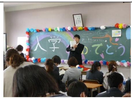
【初めての学級活動】