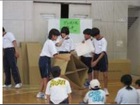
[段ボールベッドについて]