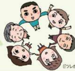
イラスト: 細川紹々 〔「ツレがうつになりまして。」著者〕

悩んだ時、どこに相談したらよいか迷うことはありませんか？ 困った時は、それぞれの窓口にご相談しましょう！