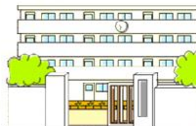
廿日市市教育委員会 ホームページより

そのため、本市の園・小中学校では平成26年度から5月8日を「命の大切さについて考える日」と設定して、すべての子どもたちが、いじめを許さず、自分や他人の命の大切さを真剣に考える取組を全市的に行っています。