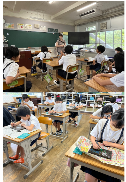
㊦8月25日登校日の様子

8月25日の登校日には久しぶりに学校に子どもの声が戻ってきました。ただ体調不良でお休みの児童もいたのが少し寂しかったですが、やはり学校には子どもの元気な姿や明るい声が似合います。「子ども達があつての学校、子どもの活気が一番」と、心からそう感じました。2学期もどうぞよろしくお願い致します。