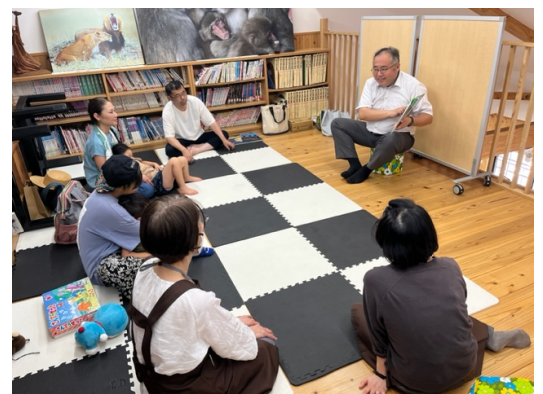
④ 浅原交流館での読み聞かせの様子

というところで、読書に関するお知らせを一つ。9月9日（土）にさいき図書館で読み聞かせの会が行われます。昨年に引き続き、校長も絵本の読み聞かせを行います。お時間のある方は、お子さんを連れて是非、お立ち寄りください。ちなみに浅原交流館でも8月20日（日）に校長が読み聞かせを行いました。この会には残念ながら津田小の児童が一人もいなかったのが少々寂しい思いをしましたが、9月9日は是非ともお越しください。お待ちしております。