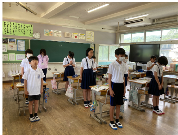
㊤ 静かに黙とうする5年生の児童

7月6日の黙とうの前に少しだけ児童に私の体験の話をし、静かに1分間目を閉じ哀悼の念をおくりました。