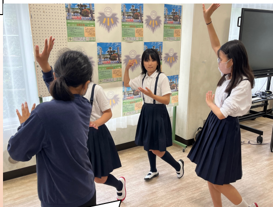
3・4年生に「津田音頭」を教える6年生です。