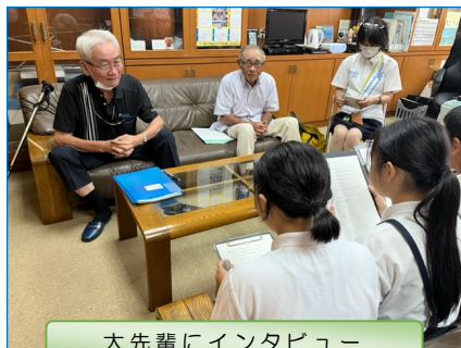
大先輩にインタビュー

10月になれば準備もラストスパートに入ります。150年という長い年月の重みを感じながら、津田小学校と地域にとって、当日がかけがえのない1日となるように引き続き頑張っていきたいと思えます。