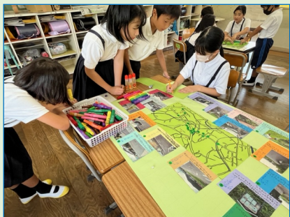
津田に住むみなさんの生活・安全に役立とうれしいです!