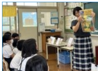
ブクトークの様子

9月13日(水)には、3・4年生は市民図書館の方やボランティアさんによる「ブクトーク(あるテーマで何冊かの本を順に紹介することで児童に読書への興味をもたせる方法)」をしていただきました。それぞれお気に入りの本が見つかった様子で、「続きが早く知りたい。」「図書室に行って本を探そう。」と、読書の秋に向けて、いい時間を過ごすことができました。