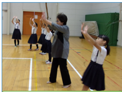
いい発表ができるように練習中！