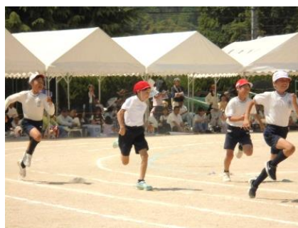
<運動会、全力で競います>