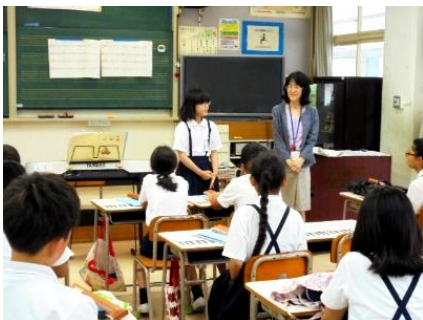
<着ベルで授業開始>