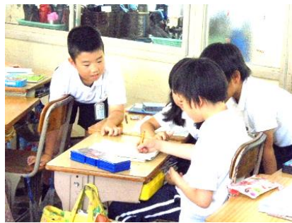
<教え合い助け合う>