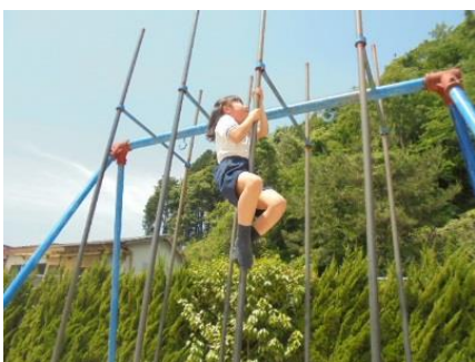
<休憩時間に登り棒で>