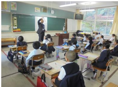
<2年 九九でビンゴ大会>

さて、入学・進級から7か月が経ちましたが、子供たちの成長ぶりはいかがだったでしょうか。学校では一人一人が友達と仲良く楽しく活動したり学んだりしながら自分の力を伸ばしていけることが目標です。そのための指導の工夫や集団作り等に全教職員が日々悩みながらも頑張っています。下の写真はその姿の一端です。子供たちが協働し、学力をつけていくことができるように頑張っていきます。これからもご理解とご支援をよろしくお祈りします。