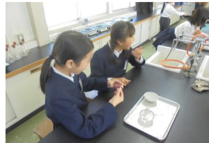
<4年 アルコールランプの使い方>

また、お忙しい中を学校アンケートへのご協力をありがとうございました。アンケートについては次のような結果となりました。