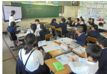
<5年 日本の工業について>