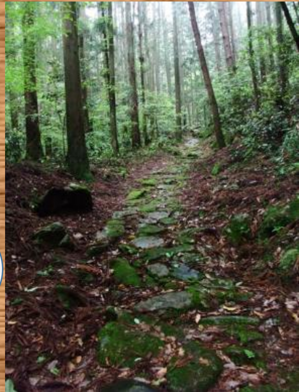
津和野街道にある石畳